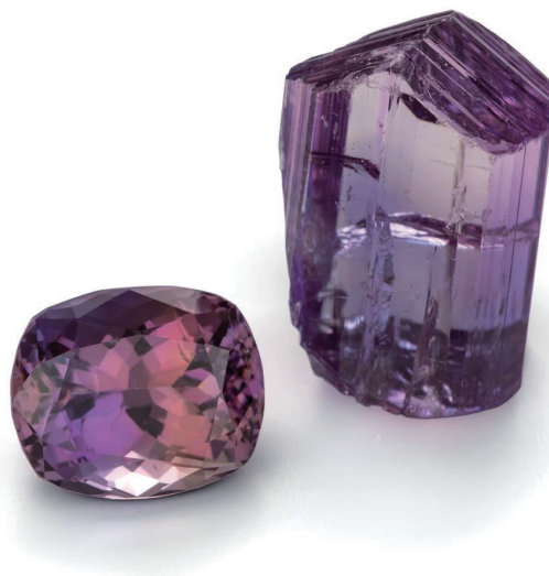
丹泉石晶體和刻面寶石。