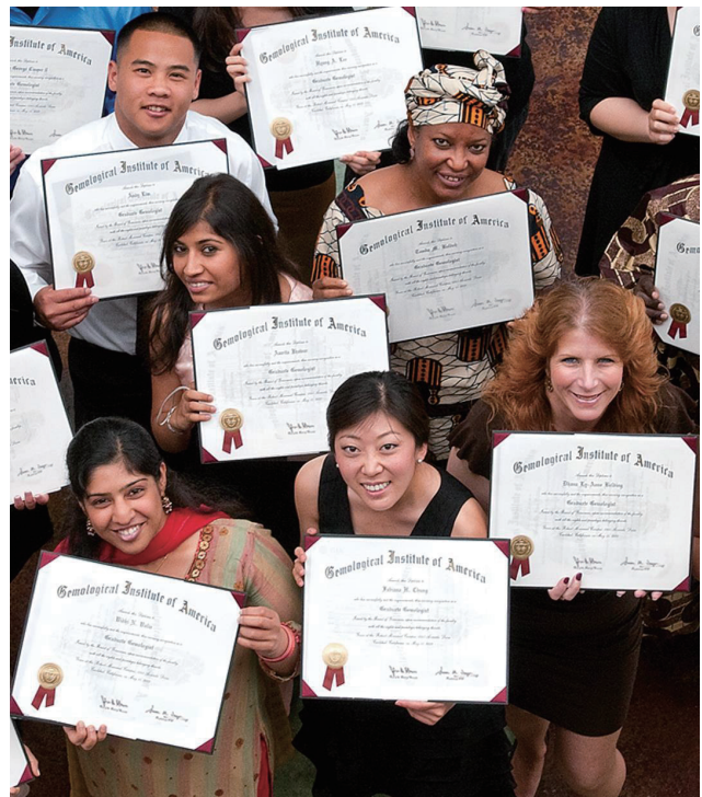
Earn your GIA credential and find your ideal career.

想要確認GIA畢業生之證書者，可以查閱GIA校友在線目錄 (GIA Alumni Online Directory)，搜索結果將會呈現出那些選擇將其資訊顯示在網路上的畢業生。個人還可以通過在我們的網站 gia.edu/doc/GIA_Education_Verification-Request.pdf 上提交請求表來提交書面請求，以驗證畢業生的證書。有關通訊資訊可能會或不會揭露的資訊，請參閱第41頁的美國家庭教育權利和隱私法 (FERPA)。