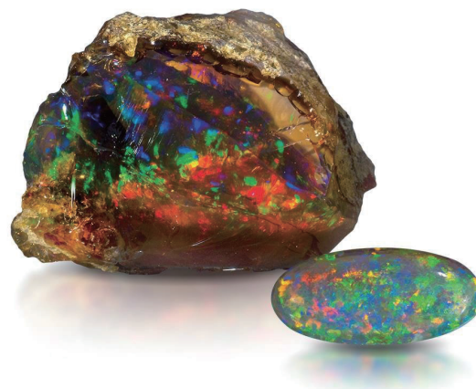
蛋白石原石和磨光後蛋白石。

自訂進度、修業期限：6個月 單元數量：8 獲得：珍珠結業證書 (Pearls Certificate)