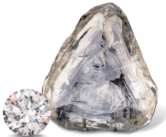
上圖：原石與已切磨鑽石。

教室配備一個GIA DiamondDock™、一個紫外線燈和觀察箱。屬於課程材料一部分，學員會收到：鑷子、10倍手持放大鏡、探針、製圖筆、寶石擦布、桌面量尺、冠角量尺、成色分級紙托、鑽石分級鑑定手冊、及鑑定相關教材等。