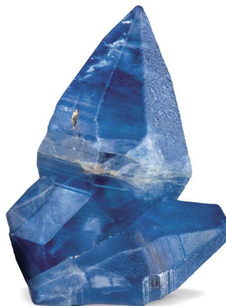
藍寶石原石。