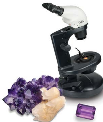
Gem courtesy: Ramiro Rivero & Metals del Oriente S.R.L. Crystal courtesy: Michael Evans.