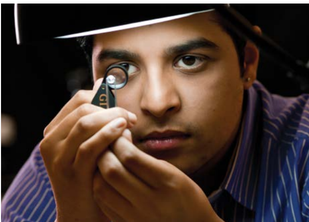
Above - Student using a loupe to examine a gemstone.