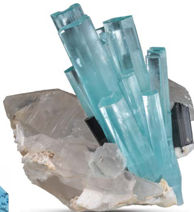
Cut gem courtesy: Glenn Preus Rough crystal courtesy: Neal Litman Company