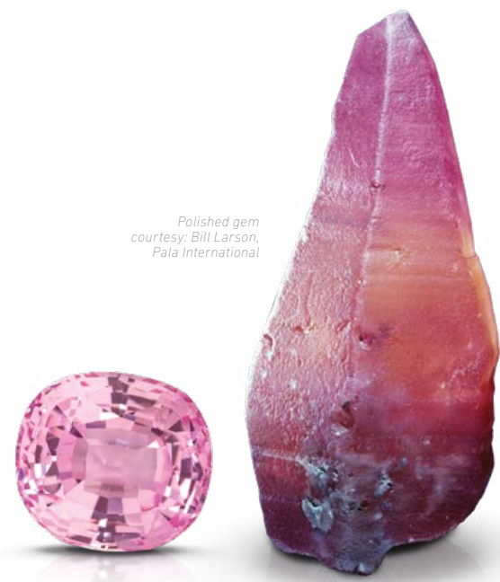
Polished gem courtesy: Bill Larson, Pala International

課堂時間和時數 課堂時間可能因假期，休息或其他項目而有所不同；請仔細查看時間表並相應地進行規劃。 課堂時間列於第40頁。