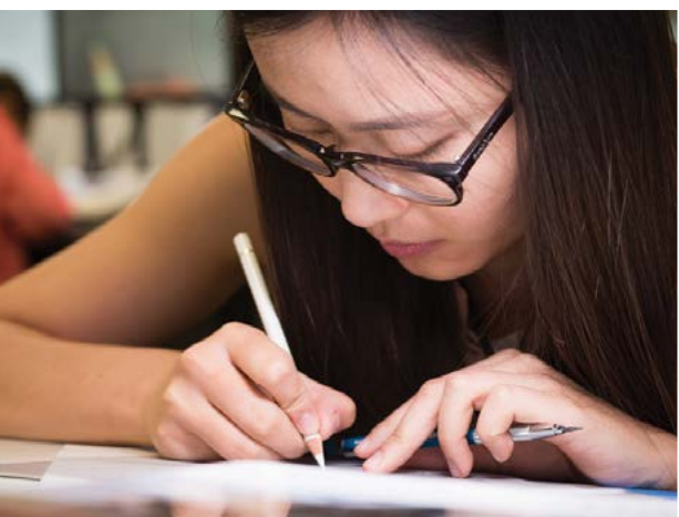
Above - Students hand-illustrating faceted gemstones