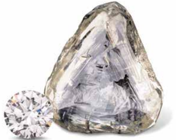
上圖：原石與已切磨鑽石。