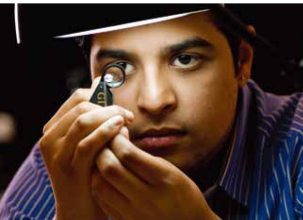
上圖：學生使用手持放大鏡檢查寶石