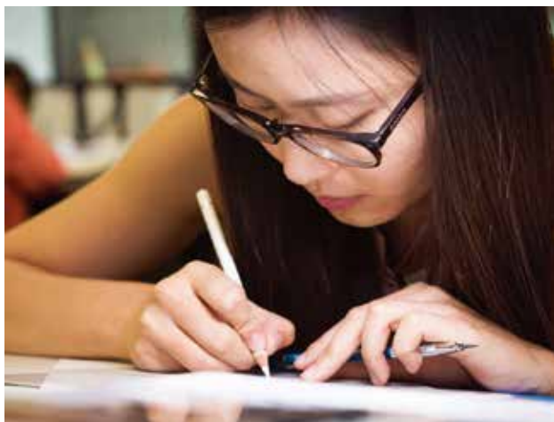
學員手繪刻面寶石