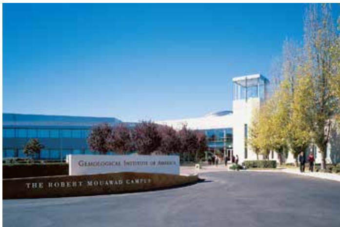
上圖：位於加利福尼亞州卡爾斯巴德GIA世界總部的羅伯特賈瓦校區。

當時大多數的珠寶商只略知他們所販售的寶石，所以Robert Shipley決定通過教育、研究和寶石學儀器來專業化這個行業。此機構最初以Shipley夫婦自家為基地，藉助顯微鏡及其他儀器，提供郵件訂購課程以及珠寶鑑定服務。由最初的小規模慢慢累積，美國寶石研究院現在於全球六個國家已有七個分校、365,000名學生及校友，並且有專業鑑定所鑑定全世界最重要的鑽石，還有頂尖的珠寶研究中心，為鑽石4Cs(成色、淨度、切磨和克拉重量)的創始者，亦是國際鑽石分級系統發源地。